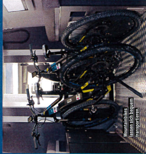
Mountainbikes lassen sich bequem transportieren.