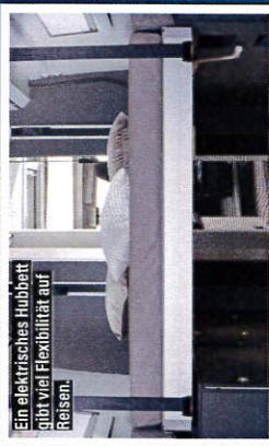
Ein elektrisches Hubbett gibt viel Flexibilität auf Reisen.