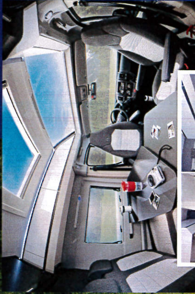
Im edlen Innenraum hat es Platz für eine Sitzcke und ein Bett.